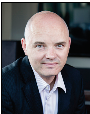
Dylan Jones Sous-ministre, Diversification de l'économie de l'Ouest Canada

Ces commentaires constituent la base de Croissance de l'Ouest : La Stratégie de croissance de l'Ouest canadien . Croissance de l'Ouest un appel à l'action qui invite le gouvernement et ses partenaires à faire preuve d'audace et à travailler ensemble pour relever les défis et exploiter les possibilités de l'Ouest. Ensemble, nous exploiterons le potentiel de tous les Canadiens de l'Ouest et nous contribuerons à bâtir l'avenir de l'Ouest canadien.