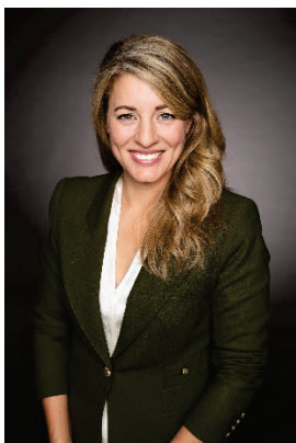
L'honorable Mélanie Joly Ministre du Développement économique et des Langues officielles

Il y a beaucoup de travail qui nous attend, mais aussi de grandes occasions. Je vous invite à lire ce plan pour obtenir des détails sur les priorités de Diversification de l'économie de l'Ouest Canada et sur notre volonté à les réaliser dans le cadre de nos efforts pour répondre aux besoins des Canadiens de l'Ouest.